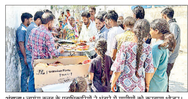
अंबाला। लायंस क्लब के पदाधिकारियों ने भंडारे में ग्रामीणों को करवाया भोजन।