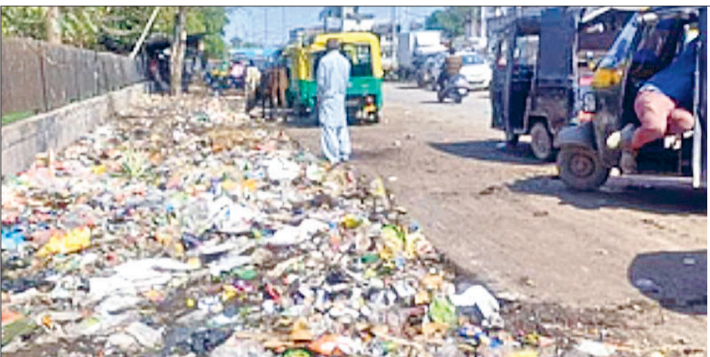
अंबाला। बस स्टैंड के बाहर सड़क किनारे पड़े कूड़े का दृश्य।

जाते हैं, न तो वो गली में कुछ देर के लिए ठहरते हैं और न ही कूड़ा उठाने के लिए कोई सूचना देते हैं। ऐसे में उन्हें मजबूरन प्राइवेट कर्मचारियों से कूड़ा उठवाना पड़ता है और इसके लिए उन्हें प्रतिमाह 200 रुपये देने पड़ रहे हैं। इस समस्या के लिए भी लोगों ने सदस्य को जानकारी देने के निर्देश दिए गए हैं। ज्यादातर वार्ड सदस्यों ने यह भी मांग रखी कि कूड़े का निस्तारण सुबह और शाम को दो बार किया जाए ताकि लोगों को गंदगी की परेशानी से जूझना न पड़े।