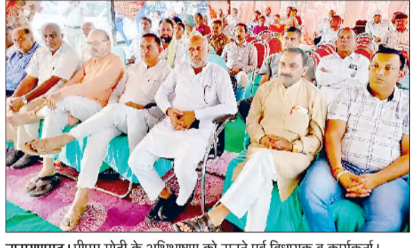
नारायणगढ़। पीएम मोदी के अभिभाषण को सुनते पूर्व विधायक व कार्यकर्ता।

प्रधानमंत्री नरेंद्र मोदी ने शनिवार को दिल्ली से प्रधानमंत्री धन-धान्य कृषि योजना और दलहन आत्मनिर्भरता मिशन का शुभारंभ किया। साथ ही कृषि अवसंरचना कोष, पशुपालन, मत्स्य पालन और खाद्य प्रसंस्करण क्षेत्र से जुड़ी 1100 से अधिक परिवर्णयोजनाओं का उद्घाटन एवं शिलान्यास किया। प्रधानमंत्री ने इस दौरान देश के विभिन्न क्षेत्रों में स्थित किसानों से संवाद किया और कहा कि कृषि