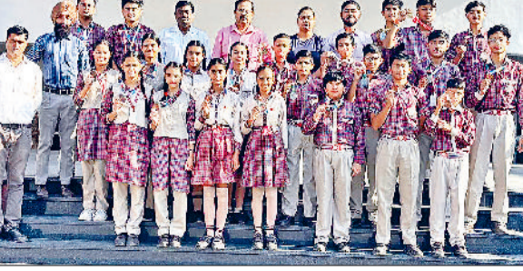
अंबाला। खेल के मैदान में दम दिखाने वाले खिलाड़ियों के साथ प्रिंसिपल व अन्य।

अंबाला शहर के डीएवी पब्लिक स्कूल के खिलाड़ियों ने नया इतिहास इतिहास रचकर राज्य व राष्ट्रीय स्तर पर चमका विद्यालय का परचम लहराया है। खेल के मैदान में स्कूल के खिलाड़ियों ने एक बार फिर अपने दमखम और प्रतिभा का लोहा मनवाया। डीएवी क्लस्टर एवं