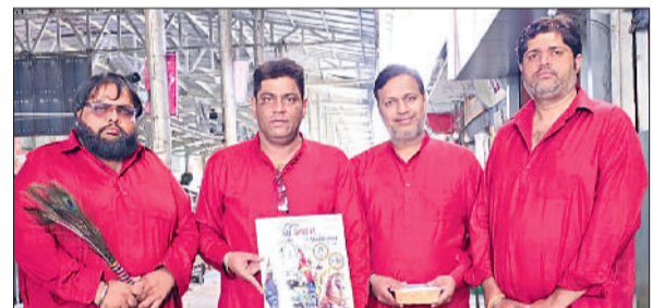
पानीपत। खाटू धाम में बाबा श्याम को श्री श्याम शाही शोभा यात्रा का पहला आमंत्रण देते हुए लखदातार सेवा समिति के पदाधिकारीगण।