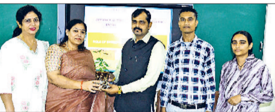
पानीपत। आईबी कालेज में अतिथित को पीछा भेंट करते हुए अध्यापिकाएं।