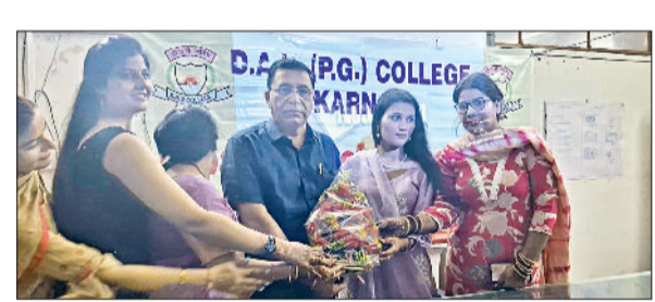
उत्कृष्ट प्रदर्शन करने वाले विद्यार्थी सम्मानित