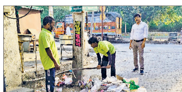
घरौंडा। सफाई अभियान में जुटे नगर पालिका के कर्मचारी।

घर, मोहल्ले व शहर को स्वच्छ बनाना सभी की जिम्मेदारी