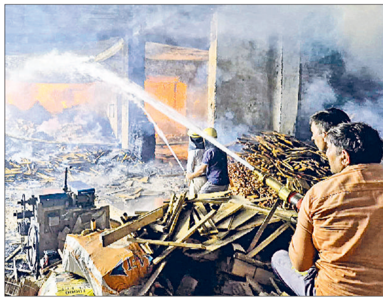
यमुनानगर। पुरानी लकड़ मंडी स्थित जीटीबी टिंबर फैक्ट्री में लगी आग को बुझाते दमकल कर्मी।

आग से फैक्ट्री के एक तरफ का शेड भी जलकर नीचे गिर गया। फैक्ट्री में पड़ा लकड़ी, मशीनरी व तैयार माल जलकर राख हो गया। आग लगने का कारणों का फिलहाल पता नहीं चल पाया है।