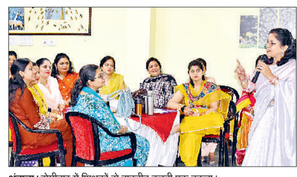
अंबाला। सेमिनार में शिक्षकों से बातचीत करती एक वक्ता।