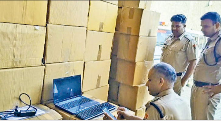
करनाल। अवैध पटाखों के स्टॉक को कब्जे में लेने के बाद कार्रवाई करती पुलिस की टीम।