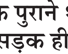
तरावड़ी। पुराने थाने और जगदंबा मंदिर के आसपास की सड़कें व बिना ढक्कन मैनेहोल।